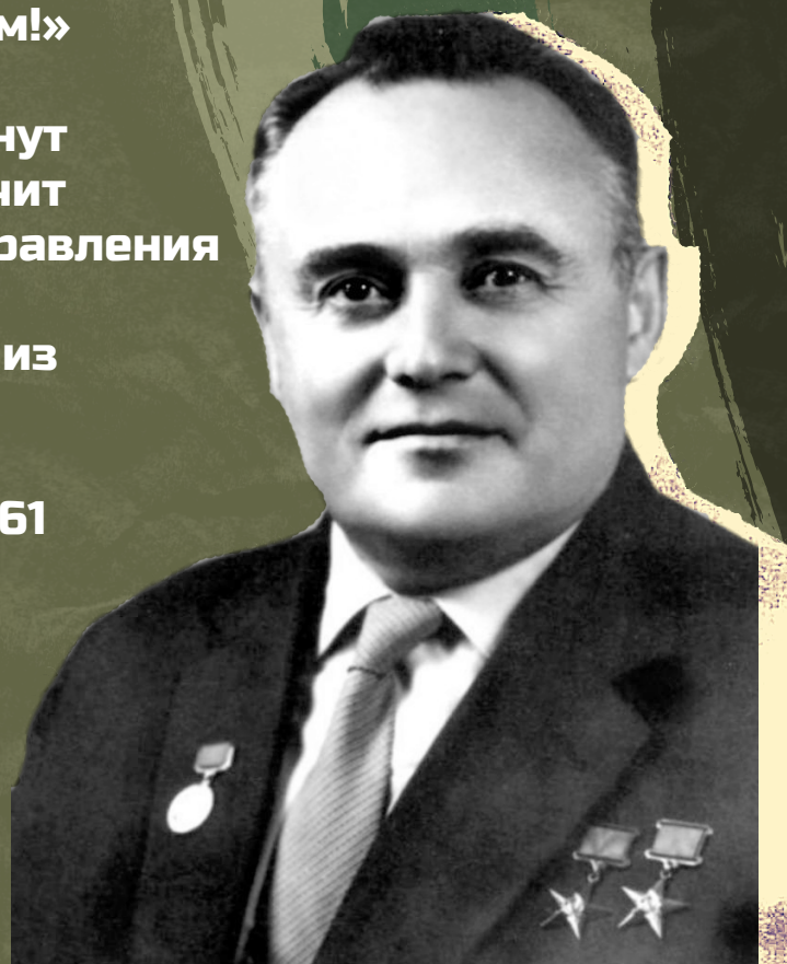
С. П. Королёв

Так, в памятный день 12 апреля 1961 года над планетой поднялось утро космической эры. Все как замороженные стояли, задрав головы вверх, вслед улетающему Ю.А. Гагарину.