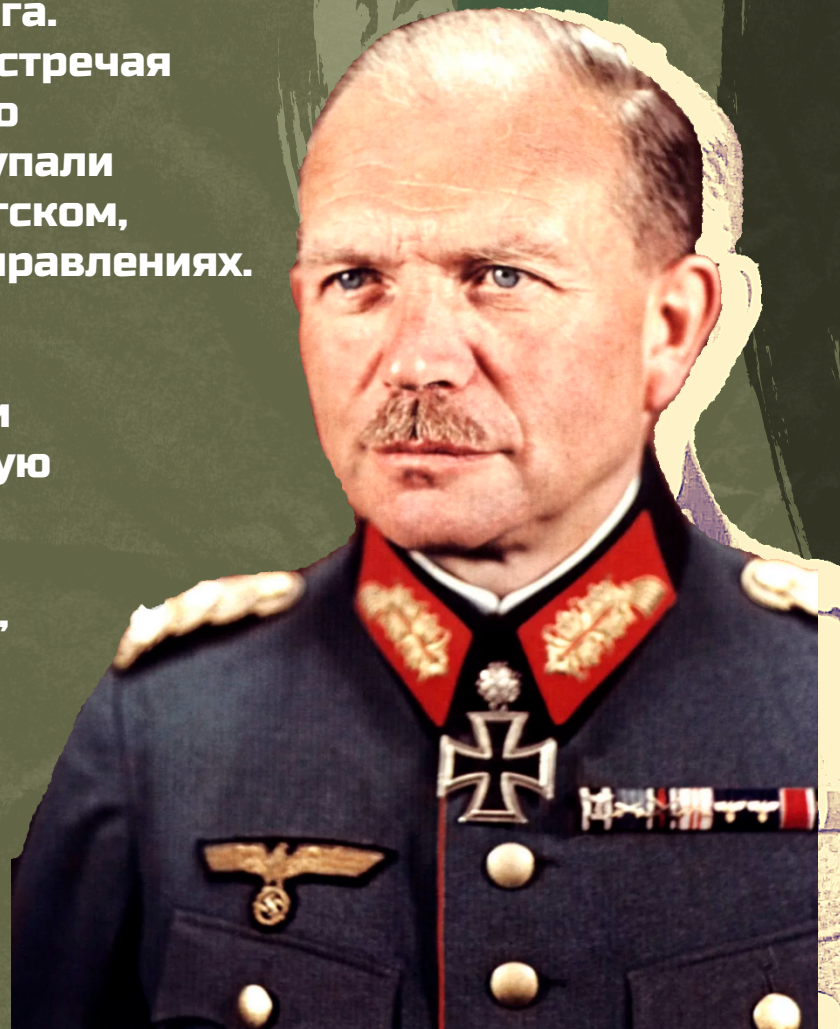
инициатор создания группы армий "Висла" Хайнц Гудериан

В ходе Берлинской операции советские войска окружили и ликвидировали самую крупную в истории войн группировку вражеских войск. Они разгромили 70 пехотных, 23 танковых дивизий противника, взяли в плен 480 тысяч человек.