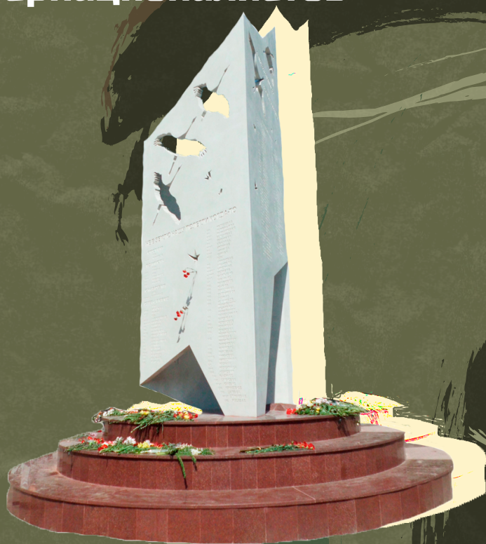
Монумент воинам-интернационалистам (г. Калуга)