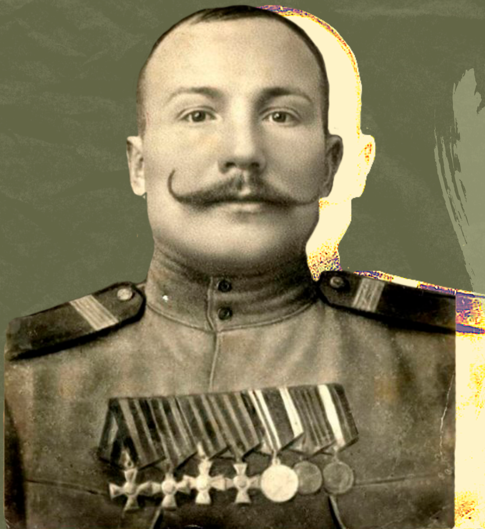
Герой Русско-Японской войны, и пример защитника Отечества Аввакум Николаевич Волков

С 2002 г. по решению Государственной думы ФС РФ 23 февраля в России является нерабочим днем.