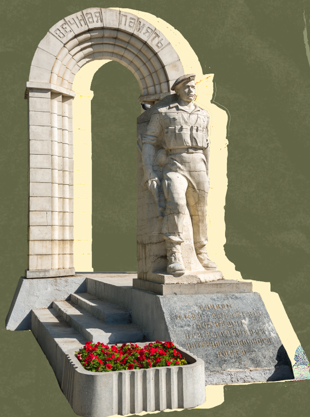
Памятник воинам-интернационалистам (г. Калуга)

В 2010 году "День памяти воинов-интернационалистов" приобрёл официальный статус. Федеральным законом от 29 ноября 2010 г.