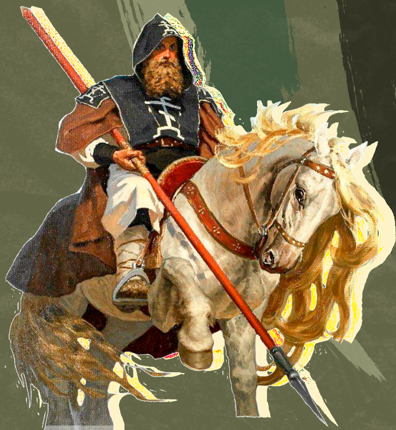
Герой битвы на Куликовом поле и пример защитника Отечества монах Пересвет

В 1923 г. в постановлении президиума ВЦИК, принятом 18 января, говорилось: "23 февраля 1923 г. Красная Армия будет праздновать 5-ю годовщину своего существования. В этот день, пять лет тому назад, был опубликован Декрет Совета народных комиссаров от 28 января того же года, которым было положено начало Рабочее-крестьянской Красной Армии, оплоту пролетарской диктатуры".