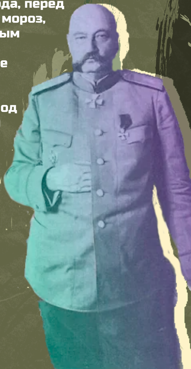
Генерал Николай Николаевич Юденич (30.07.1862 - 05.10.1933)

Разгромив 3-ю турецкую армию и продвинувшись с боями на 150 километров, наши войска потеряли убитыми и ранеными чуть более 8 тысяч человек. Урон же врага составил 66 тысяч погибших и получивших ранения, не считая 13 тысяч, попавших в плен.