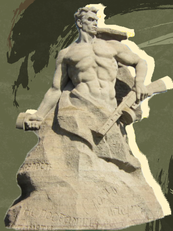
Памятник-ансамбль героям Сталинградской битвы (г. Волгоград, Мамаев Курган)