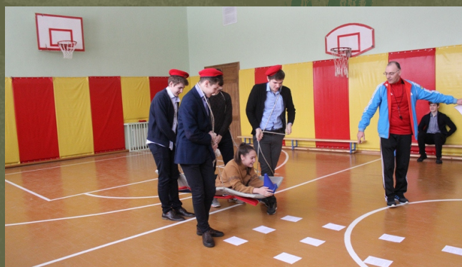
Станция "Минное поле"