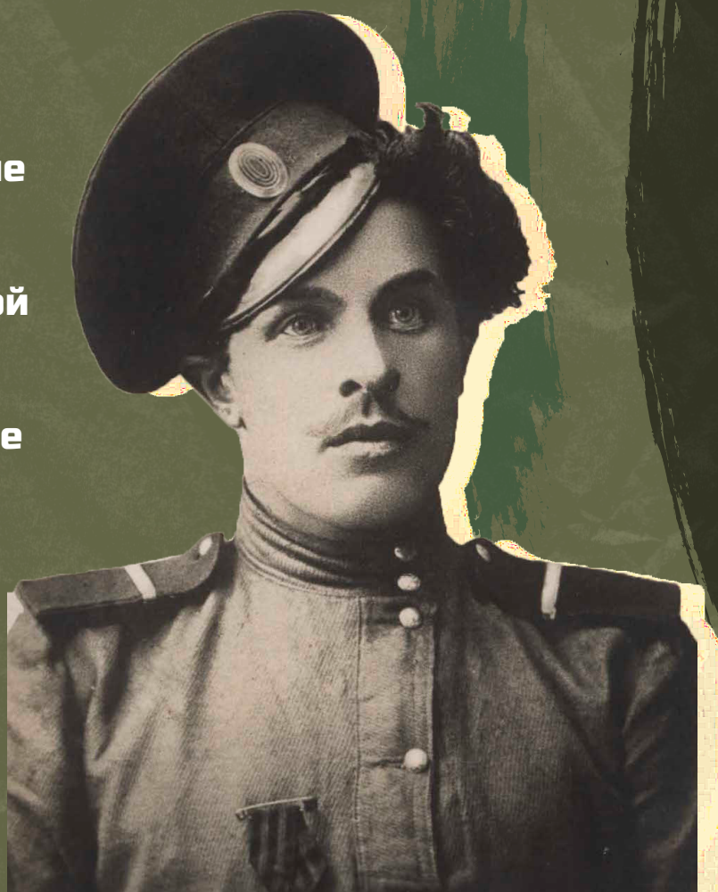
Герой Первой Мировой войны и пример защитника Отечества

В первые дни января 1919 г. советские власти вспомнили о приближающейся годовщине декрета Совнаркома об организации РККА. 10 января председатель Высшей военной инспекции РККА Николай Подвойский направил в президиум ВЦИК предложение отпраздновать годовщину создания Красной Армии, приурочив празднование к ближайшему воскресенью до или после 28 января. Однако из-за позднего предоставления ходатайства решение не было принято.